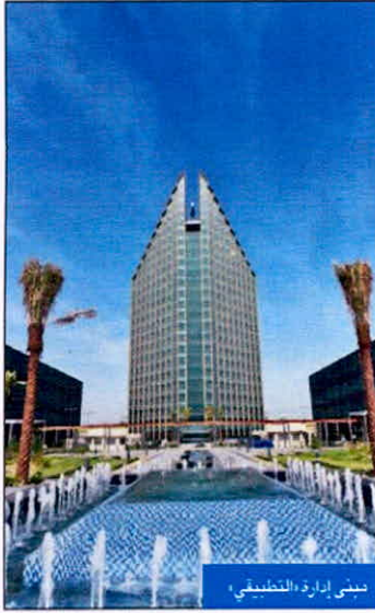
مبنى إدارة التطبيقي

«ليس هناك جدية في تطبيق قانون جامعة جابر»